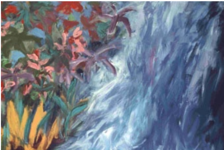
Fig. 12 - Teresa Poester, acrílico sobre tela, 1990, 90 x 130 cm, Porto Alegre.

Nas paisagens, era a estrutura das grades verticais que vinham dos balcões espanhóis que criava o contraponto com a pincelada mais solta no fundo. Essa estrutura dava o ritmo da composição (fig 13).