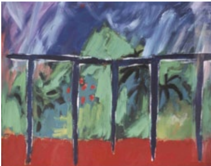
Fig. 13 - Teresa Poester, acrílico sobre tela, 1992, Porto Alegre, 70x 100 cm.

Nas paisagens, era a estrutura das grades verticais que vinham dos balcões espanhóis que criava o contraponto com a pincelada mais solta no fundo. Essa estrutura dava o ritmo da composição (fig 13).