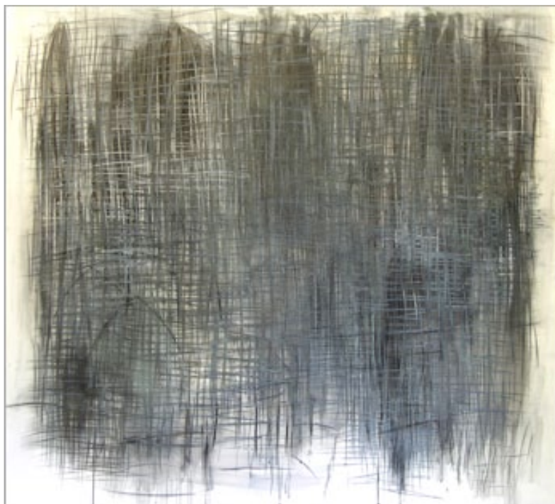
Fig. 20 - Teresa Poester, lápis grafite sobre papel, 2000, 160 x 160 cm, Paris.

Mas os traços das grades se tornavam obsessivos, e houve um momento, representado por este trabalho, que pensei estar sem saída, enredada numa armadilha (fig. 20).