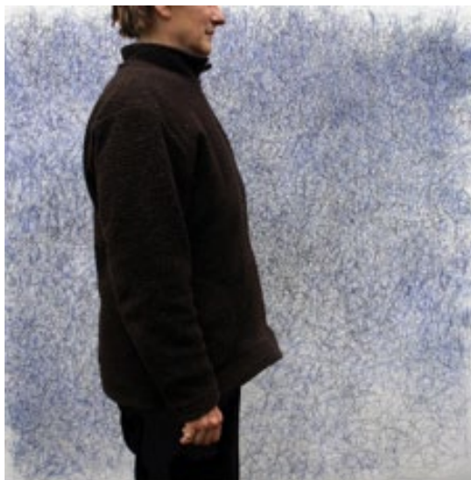
Fig. 24 - Teresa Poester, caneta bic sobre papel, 2009, 150 x 150 cm, Porto Alegre.