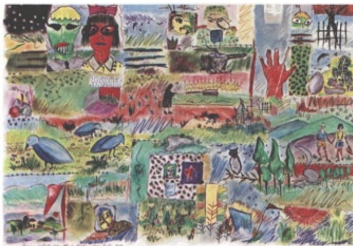
Fig. 4 - Teresa Poester, lápis de cor sobre papel, 1983, 70 x 100 cm, Porto Alegre.

Desde estudante no IA, dava aulas para crianças na Escolinha e sentia uma coisa macabra nos contos de fada, gostava de explorar esses contrastes. João e Maria é um dos desenhos a lápis de cor baseado em história infantil. E aí aparece também a estrutura de grades na maneira de dispor os elementos (fig. 4).