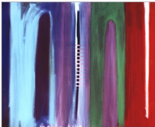
Fig. 15 - Teresa Poester, acrílico sobre tela, 1995, 90 x 130 cm, Porto Alegre.

contrapunham às pinceladas mais soltas, uma coisa se revela pela presença do oposto. O gesto é mais solto quando em oposição a algo mais rígido, e vice-versa. Os antagonismos me interessam (fig. 15).