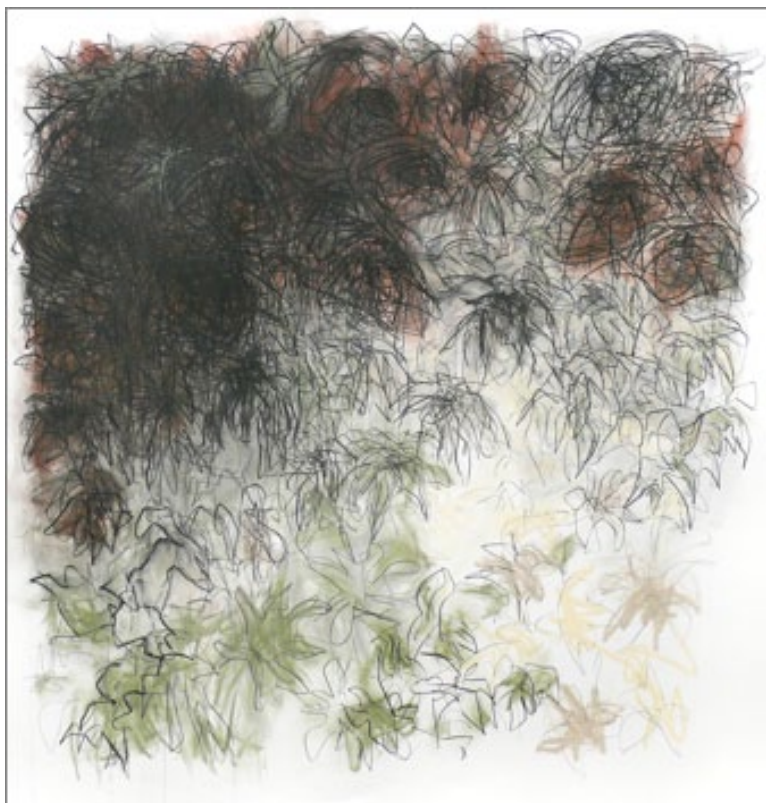
Fig. 23 - Teresa Poester, técnica mista papel, 2007, 150 x 150cm, Porto Alegre.

Com esses jardins e, depois, com as pedras, ressurge a cor. Os gestos são redondos e largos (fig. 23).