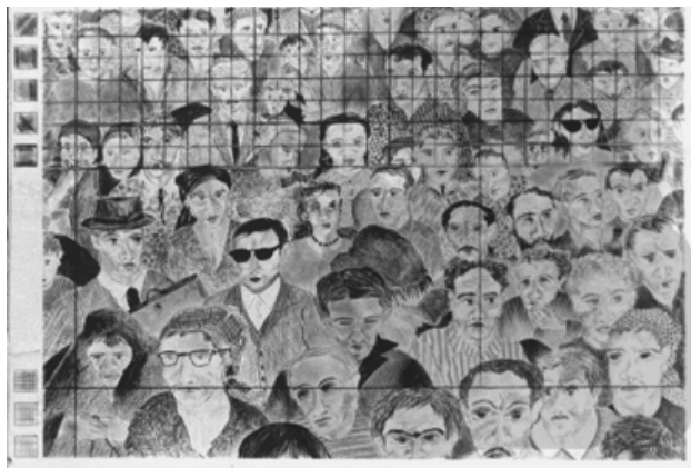
Fig. 3 - Teresa Poester, grafite sobre papel, 1985, 50 x 70 cm, Porto Alegre.