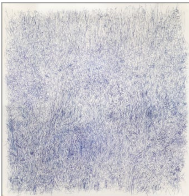
Fig. 25 - Teresa Poester, caneta bic sobre papel, 2009, 150 x 150 cm, Porto Alegre.