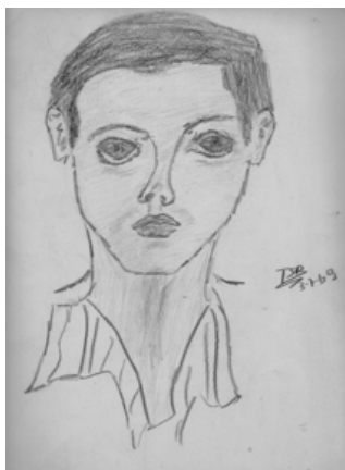
Fig. 1 - Teresa Poester, grafite sobre papel, 1969, 30 x 20 cm, Porto Alegre.

Começo a mostrar as imagens com uma curiosidade. Descobri um desenho antiquíssimo que resolvi escanear. É de 1969, vocês imaginam, eu tinha 12 anos. Um trabalho de observação. Tinha aulas com uma freira que era artista e tinha um atelier numa montanha, um lugar lindo, que, naquela época, ficava no caminho de Viamão. Acho que é o primeiro desenho de modelo que fiz, ou tentei fazer. Era de um menino que morava perto do colégio (fig. 1).